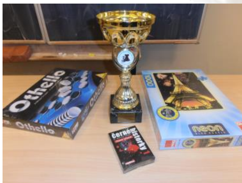
Ceny pro výherce