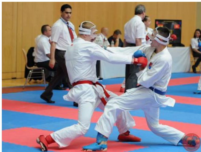
Autorka: Kateřina Dlouhá

Moc děkuju za rozhovor. Všem čtenářům přeju hodně štěstí a tobě samozřejmě taky. A pokřik? - KIA [kja]!!!